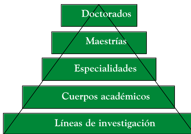
FIGURA 1. MODELO ORGANIZACIONAL DE POSGRADO

De esta manera, en el año 2004 el Consejo Universitario aprobó la creación de programas institucionales que están a cargo de varias unidades académicas, generalmente organizadas en dependencias de educación superior (DES), como son los casos de las especialidades en ortodoncia, periodoncia y endodoncia, propuestas por las facultades de Odontología Mexicali y Tijuana; y el programa de doctorado en ciencias educativas, ofrecido de manera conjunta por el